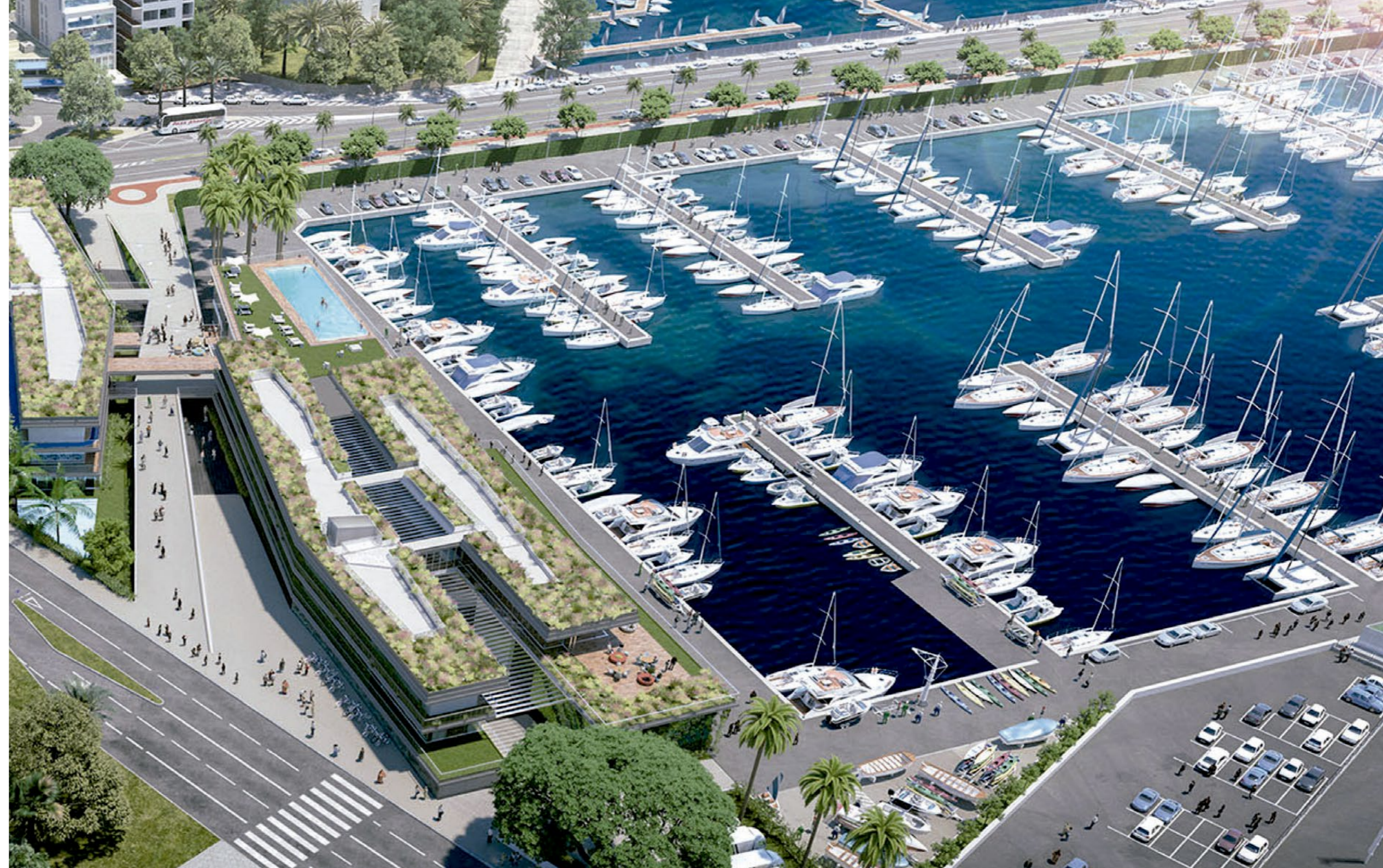
Proyecto “Club de Mar” / “Club de Mar” future project.

IN ADDITION, THE MARINA MODERNIZATION PROJECT IS CURRENTLY BEING CARRIED OUT, AND IT WILL EVENTUALLY BECOME ONE OF THE MOST IMPORTANT RECREATIONAL NAUTICAL PORTS IN THE MEDITERRANEAN AND IN SPAIN.